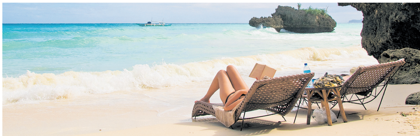
Unterwegs in der Welt und zwischen den Zeilen – Bücher für und über den Urlaub

Jedes Jahr vergibt die Messe Berlin die ITB-BuchAwards in unterschiedlichen Kategorien. Prämiert werden herausragende Bücher, die zu den Themen Reise und Tourismus erschienen sind. Den Innovationspreis 2011 erhielt unter anderem der Dumont Bildatlas. Seit gut einem Jahr existiert dieses monatlich erscheinende Reisemagazin. Jede Ausgabe widmet sich mit großformatigen Abbildungen, Hintergrundberichten und praktischen Reisetipps einem Land, einer Region oder einer Stadt. Folgend stellen wir fünf weitere Gewinner vor.